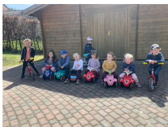
Städt. Kindereinrichtung Mäuseburg Eifelstr. 68, 52224 Stolberg-Vicht

Es wurden 5 Rutscherautos und 2 Laufräder gespendet. Leider konnten wir sie nicht persönlich überreichen.